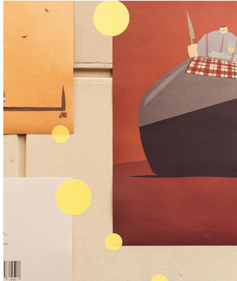
Mostra Posterheroes, Poormanger, Torino, 2017