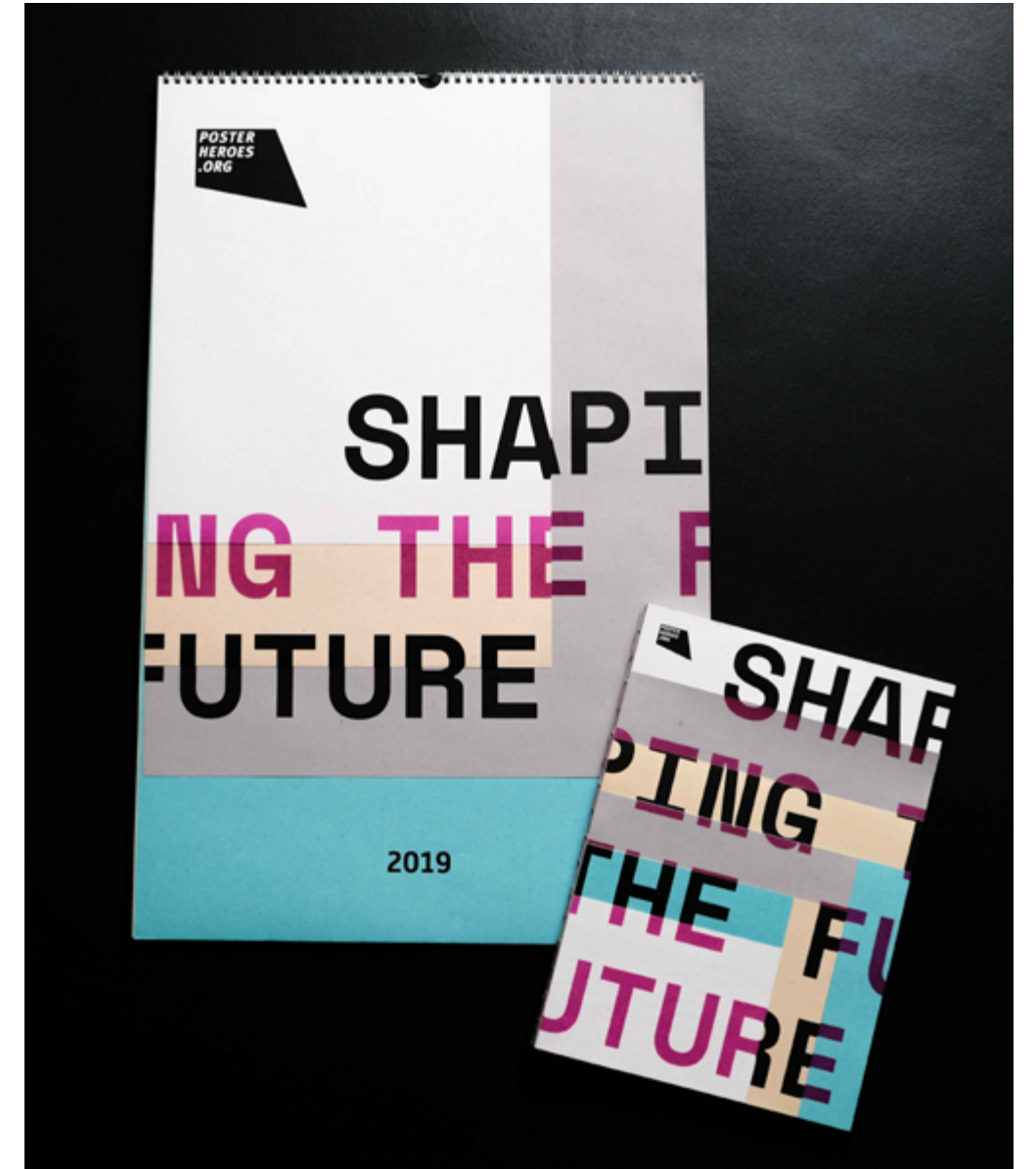
Calendario e catalogo, Shaping the future, 2017-2018