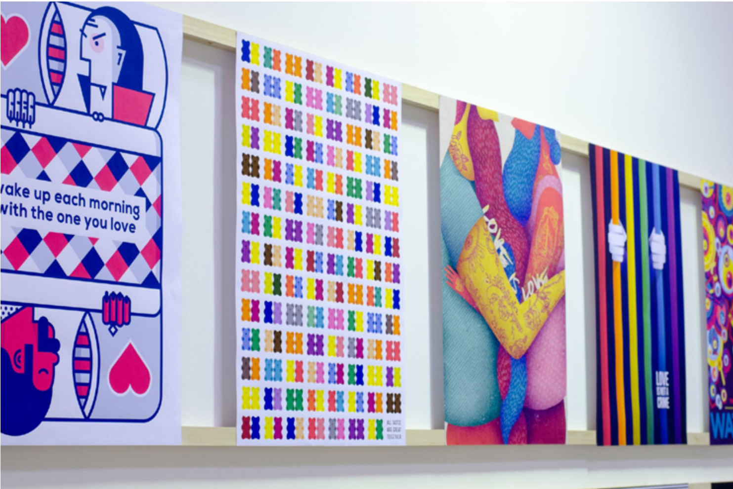
Mostra Posterheroes, Torino Graphic Days, Toolbox Coworking, 2016