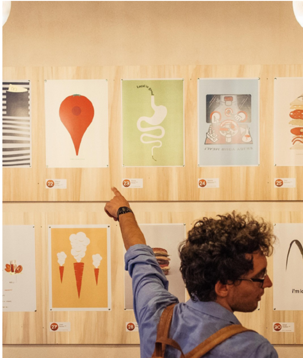
Mostra Posterheroes, Poormanger, Torino, 2017